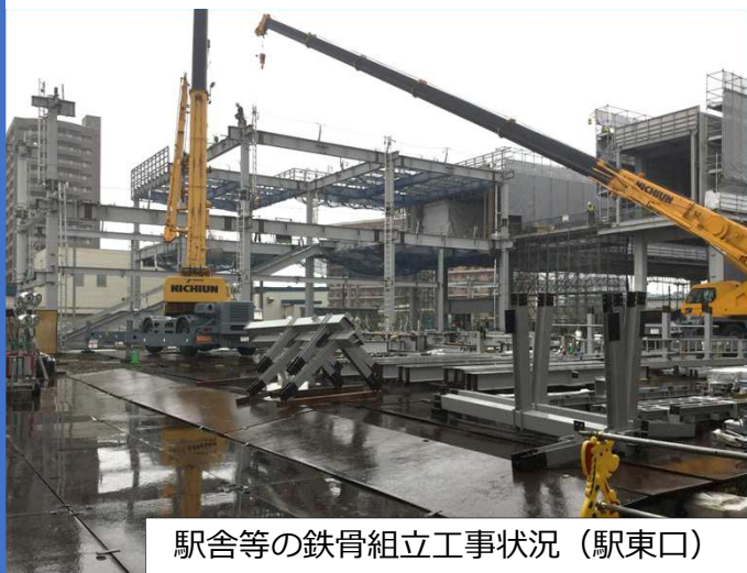
駅舎等の鉄骨組立工事状況（駅東口）