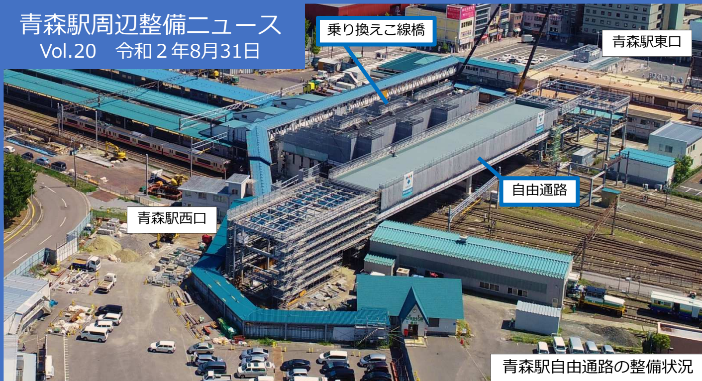
青森駅自由通路の整備状況