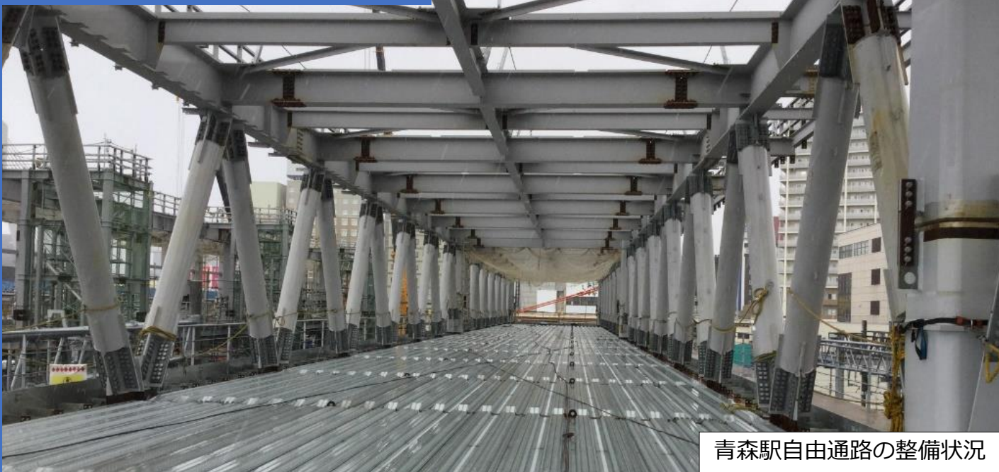
青森駅自由通路の整備状況