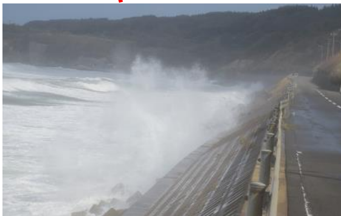
※高波による交通障害写真