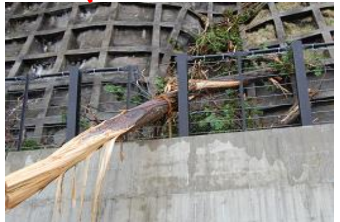
※暴風による倒木被害写真