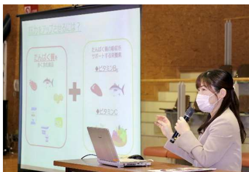
スポーツ栄養教室

大会初日、本会の管理栄養士が参加選手を対象に、試合前後の補食の取り方やバランスよく食べることの大切さを伝える講義を実施しました。運動前は、おむすびやおもちなどの糖質でエネルギー補給すること、運動後は疲労回復のために、糖質やたんぱく質を補給することが大切とアドバイスしました。