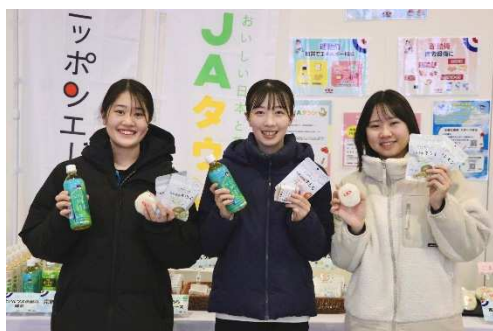
もぐもぐブースで食材を手にする選手

選手控室にブースを設置し、青森県産の青天の霹靂を使用したおむすびや、カットりんご、全農ブランド商品などの食材を提供しました。初めてブースを活用する選手も多く、「もぐもぐブースが楽しみ」「農協ミルクの芳醇メロンがお気に入り」などのコメントもいただきました。また、試合前後はもちろん、試合のハーフタイム中に、カットりんごで栄養補給するチームも見受けられました。