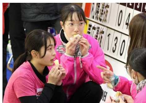
ハーフタイム中にもぐもぐ