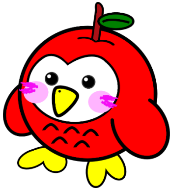
1.基本 左右反転バージョン