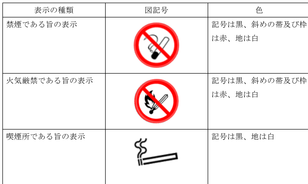
別表第 2 (第 34 条関係)