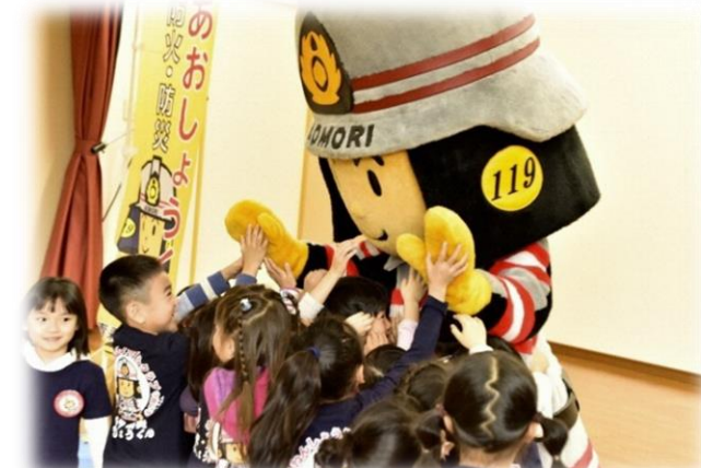
幼稚園児への防災講話