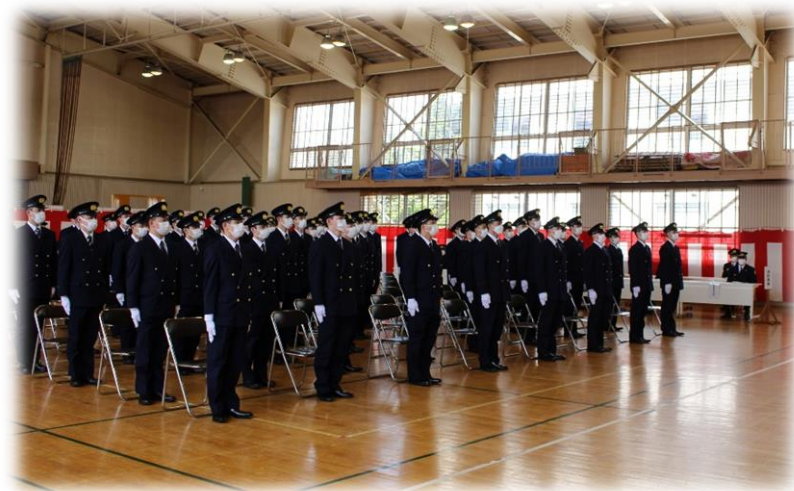
青森県消防学校入校式の様子

消防学校卒業後は、各所属で消防士として勤務します。各消防署では、消防隊、救助隊、救急隊の先輩が皆さんと一緒に勤務し、これまでの経験や知見を活かして、いろいろな訓練や教養を行いながら、皆さんをサポートします。