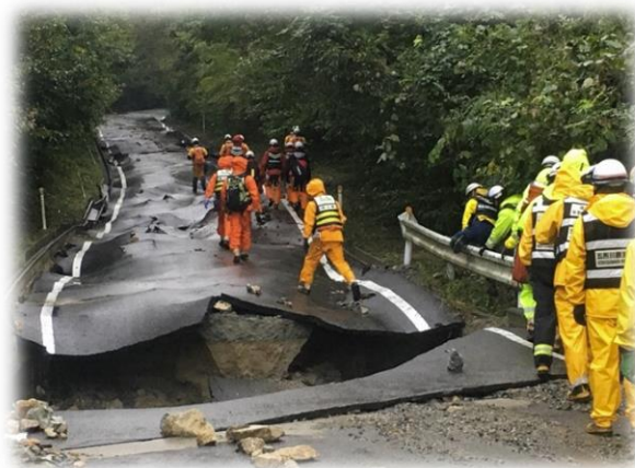
緊急消防援助隊の活動(宮城県丸森町)