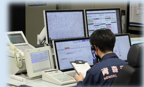
119番通報を受ける通信指令課員