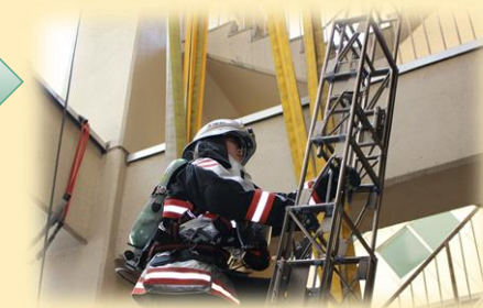
出動に備え訓練や点検を行う隊員