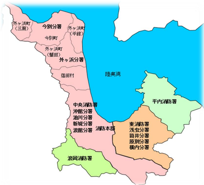
青森消防本部の消防署の配置状況