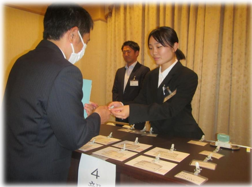
赤田消防士（令和2年度採用）

私は、地元である青森市の安全安心な街づくりに貢献したいと思い青森消防を目指しました。