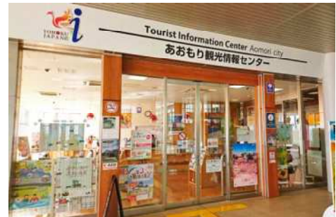
あおもり観光情報センター