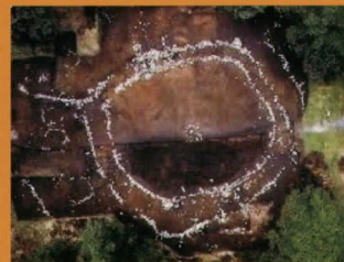
世界遺産候補の小牧野遺跡(ストーンサークル)