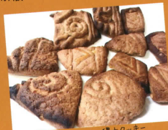
ランチタイムの縄文クッキー