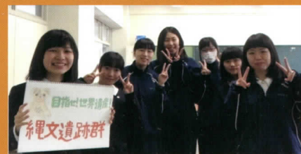
実行委員会の活動状況はコチラ！

小牧野遺跡でお客さん役になって、 子どもたちによるガイドを受けてみませんか？ 小牧野遺跡まで直接お越しください。(14:30～)