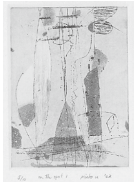
▶《on the spot 1》 2002年、銅版画

時 3月2日(土)・3日(日) 10:00~16:00 丙 グレーの繊細な色調を表現する腐食銅版画で、架空世界のカレンダーを作る 講師…漆戸美枝子さん、橋本尚彦さん 対 中学生以上10人（抽選） 料 500円 備 事前に下絵の準備が必要 ※詳細はお問合せください 甲 2月22日(金)までに、国際芸術センター青森へ