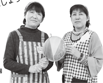
ふれあい農園 スタッフ