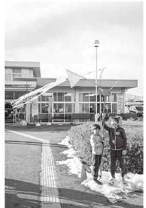
▶《LDKツーリスト》 2018年、撮影：木暮伸也

時 3月9日(土)・10日(日) 13:00~16:00 ※1日のみの参加可 丙 ACACの建物や周辺を探索し、見えないものを想像しながら旅(ツアー)を作る 講師…中島佑太さん 対 旅に出たい小学生以上のかた15人（抽選） 備 防寒具、旅に必要なもの持参 甲 3月1日(金)までに、国際芸術センター青森へ