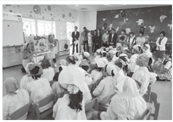
9月3日、食生活改善推進員の皆さんが、赤・黄・緑の食品の働きを分かりやすくレッスンしてくれました。

8月26日は、2018しんまちふれあい広場へ。21回目となる今年は新たに、西田沢保育園・三内保育園・奥内保育園の園児によるお遊戯や鼓笛隊、泉川小学校音楽部による吹奏楽が披露されました。新町通りでは、YOSAKOI 演舞も行われ、食べて・遊んで・楽しむ、多くの家族連れの笑顔があふれていました。