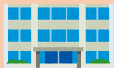
青森市ボランティアセンター (青森市社会福祉協議会)

2 青森市ボランティアセンターは、地域福祉サポーター登録者に対し「青森市ボランティアポイント手帳」を交付します。活動の際は、忘れずに携帯しましょう。