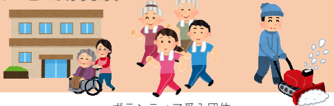
ボランティア受入団体 (地区社会福祉協議会、町(内)会、地域包括支援センター等)

3 青森市ボランティアセンターは、ボランティア受入団体と連絡調整を行い、地域福祉サポーターのボランティア活動を支援します。 ボランティアの対象事業・活動内容には、高齢者支援・介護予防、障がい者支援、子育て支援、雪対策支援に関するメニューがあります。