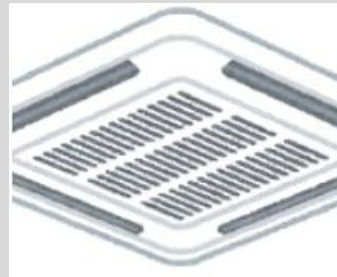
エアコン (外気換気、空 気清浄、除菌機能なし)