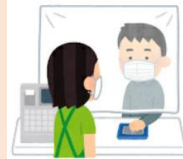
透明ビニール カーテン