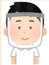
フェイスシールド