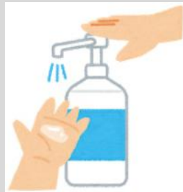
消毒用ハンドボ トル (消毒液入)