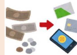
キャッシュレス決済