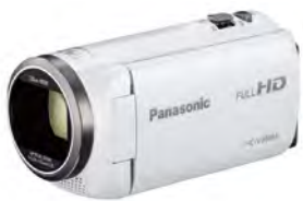
写真：デジタルビデオカメラ