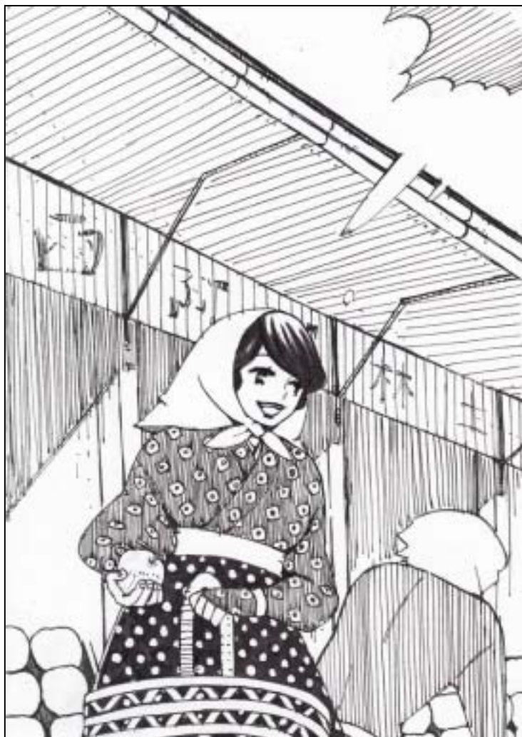
駅前のりんご市場イラスト：ひらやまよしこ