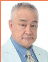
横田滋: 原田大二郎