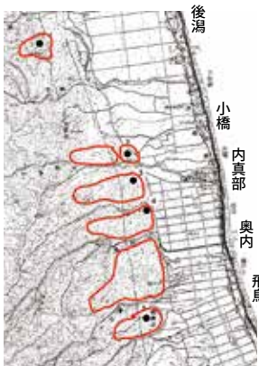
内真部城館群 (赤い囲み内)

当該城館群は、周知の埋蔵文化財包蔵地としての登録が一部しかされていないことから、その範囲を決定する分布調査が必要ですが、範囲が広大等なため、かなりの時間を要すると考えられます。市教育委員会では、発掘調査等を行う計画はないものの、包蔵地の登録を担当する県教育委員会と分布調査の相談をしてまいります。