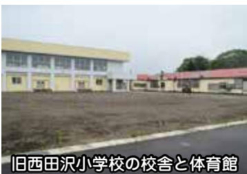
旧西田沢小学校の校舎と体育館

A 市では、旧西田沢小学校の校舎部分等の活用については、市教育委員会における協議結果を踏まえて検討していくこととしています。