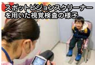
スポットビジョンスクリーナーを用いた視覚検査の様子