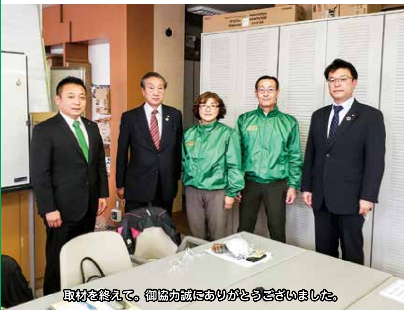
取材を終えて。御協力誠にありがとうございました。