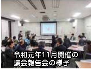
令和元年11月開催の議会報告会の様子

今期定例会では、議員提出議案として、議会報告会の開催に関する同条例の改正案を提案しました。その内容は、同条例において「毎年1回以上開催する」と定められている議会報告会について、令和2年は新型コロナウイルス感染症の感染拡大と、収束の兆しが見えない状況を鑑み、やむを得ず中止となりましたが、今後このような感染症の蔓延や大規模な自然災害の発生等により開催できないことも考えられることから、例外的に開催できない場合についての規定を加えるものとなっています。 市議会では同議案について、全会一致で可決しました。