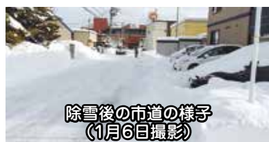
除雪後の市道の様子 (1月6日撮影)

A 市では、膝下程度の寄せ雪の処理については市民の皆様にご協力をお願いしていますが、高齢者世帯等への人力除雪の実施等、可能な限り寄せ雪の軽減に努めています。今後少しでも寄せ雪を軽減するよう、除排雪事業者への指導や技術向上に努めるとともに、寄せ雪の原因となる道路の圧雪が厚くなる前の小まめな除雪の実施など、丁寧な除雪に努めてまいります。