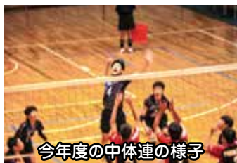
今年度の中体連の様子

Q 今年度、中体連を初めて行った宮田地区の新青森県総合運動公園は、公共交通機関で行くには大変不便な場所であるため、何らかの手が必要と考えますが、市教育委員会の考えをお示しく下さい。