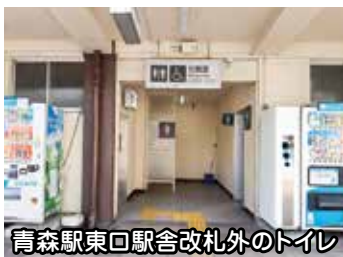
青森駅東口駅舎改札外のトイレ

A JR東日本では、新駅舎の使用開始に伴い仮設の多機能トイレを設置することでした。また、今後は東口駅舎跡地利用を含め、多機能トイレの設置について関係者間で議論し、検討することから、市としてはこの議論の中で、多機能トイレの設置について働きかけていきたいと考えています。