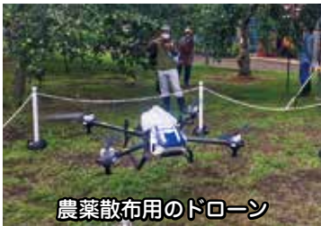
農業散布用のドローン