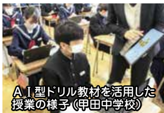
A I型ドリル教材を活用した授業の様子(甲田中学校)

Q 本市では、小・中学校の教育活動の中で、A I型ドリル教材をどのように活用しているのかお示ください。