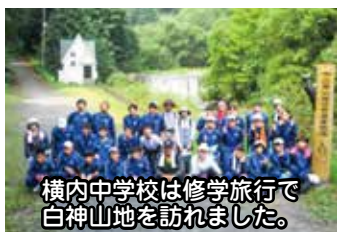
横内中学校は修学旅行で白神山地を訪れました。

Q コロナ禍の中、地元青森の魅力を発見できるような修学旅行の実施といった新たな考え方があってよいと思いますが、市教育委員会の考えをお示しく下さい。