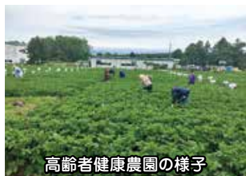
高齢者健康農園の様子

A 市では、平成19年度以降、当該農園の利用料金を2千円に据え置いできましたが、現在の料金では事業継続が困難となってきたことから、参加者に対しアンケート調査を実施しました。その結果、ある程度負担が増えても本事業を継続してほしいとの回答が多かったことから、より効果的な事業となるよう、利用料金も含めた事業内容について検討してまいります。