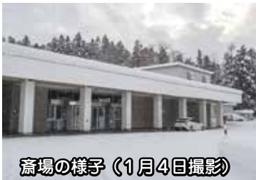
斎場の様子（1月4日撮影）

A 昭和47年9月に供用開始した青森市斎場は、火葬炉機能の維持等のため、これまでおおむね10年ごとに大規模改修を行っているほか、毎年度の定期点検等を行っています。施設の老朽化や駐車場の台数の制約、会葬者のプライバシーに配慮する必要があることなどを踏まえ、他都市の事例等を調査したいと考えています。