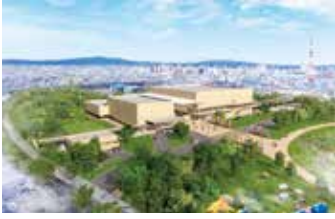
優先交渉権者からのイメージ図 (※イメージにつき、実際とは異なる場合があります。)