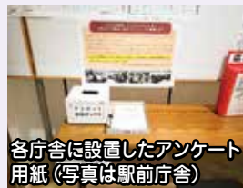
各庁舎に設置したアンケート用紙（写真は駅前庁舎）

お寄せいただきました御意見等の取扱いについては、議会広報広聴推進会議で検討してまいります。また、当該アンケートに関わらず、今後も御意見等をお寄せください。