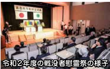
令和2年度の戦没者慰霊祭の様子

A 市では、戦没者慰霊祭について、議員御提案のとおり、参加者の座席レイアウトの工夫や段差の解消など、遺族関係者の方々の移動等にこれまで以上に配慮し、開催してまいりたいと考えています。