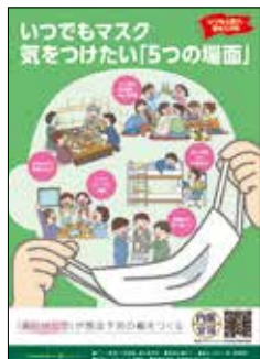
内閣府ホームページより

A 市では、これまで市の広報等を通じ、感染予防のための新たな生活様式について周知してきましたが、今般国からは、飲酒を伴う懇親会等の感染リスクが高まる5つの場面を避け、飲酒は少人数・短時間などといった注意喚起がなされたことから、日常生活や職場においても、今後、年末年始に向け気を付けていただきたいと考えています。