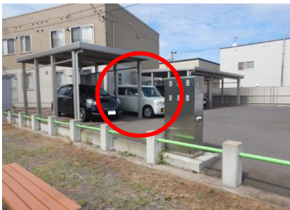
被害車両駐車箇所