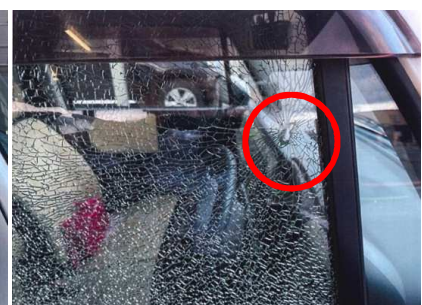
破損状況(飛び石飛散箇所)