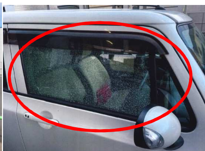
破損状況(運転席窓ガラス)