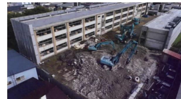
●工事状況(令和3年10月12日撮影)