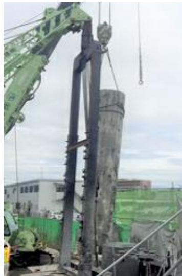
コンクリート製杭抜