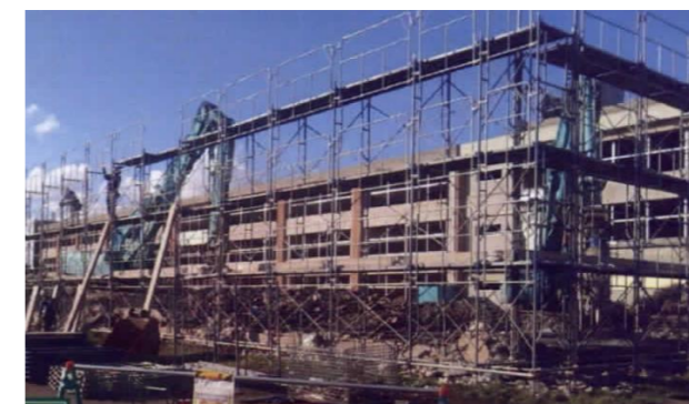
●工事状況(令和3年11月6日撮影)