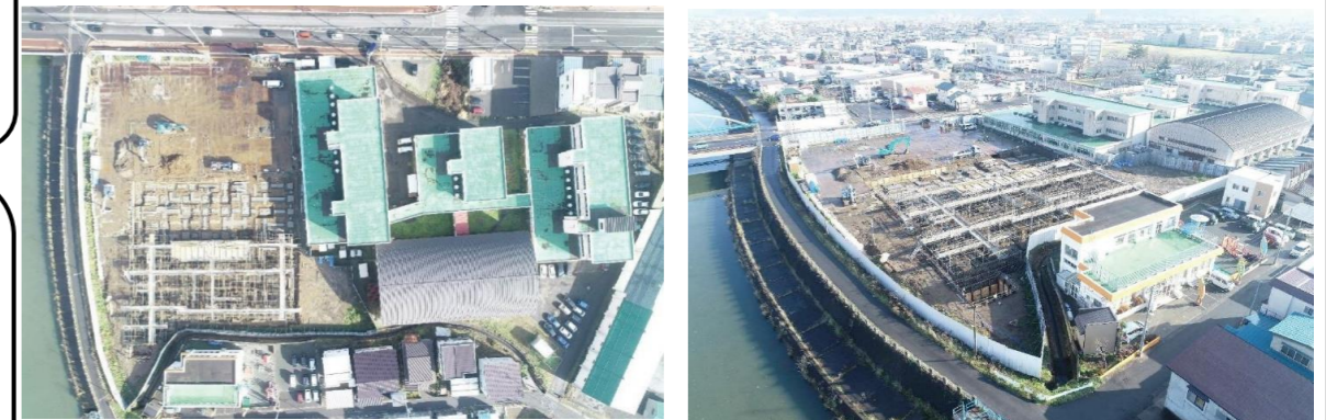
●工事状況(令和3年11月30日撮影)

この契約書に定めのない事項及び疑義の生じた事項については、発注者と受注者とが協議の上、定めるものとする。