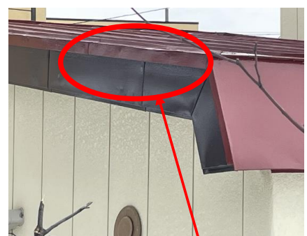
屋根材つなぎ目箇所へこみ有