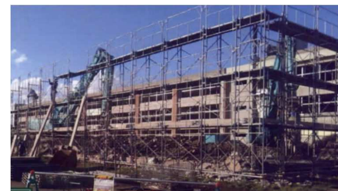
●工事状況(令和3年11月6日撮影)