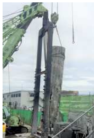
コンクリート製杭抜き