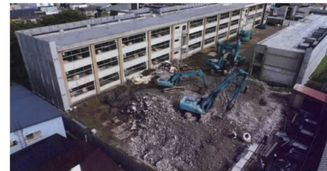
●工事状況(令和3年10月12日撮影)