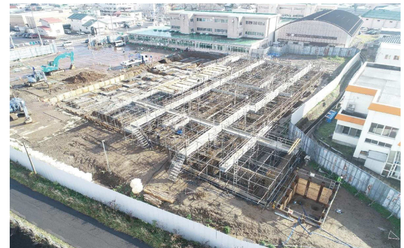
●工事状況(令和3年11月30日撮影)