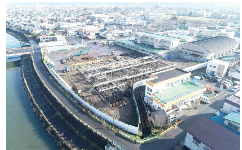
●工事状況(令和3年11月30日撮影)