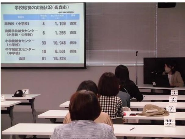
相馬栄養教諭による食育講話