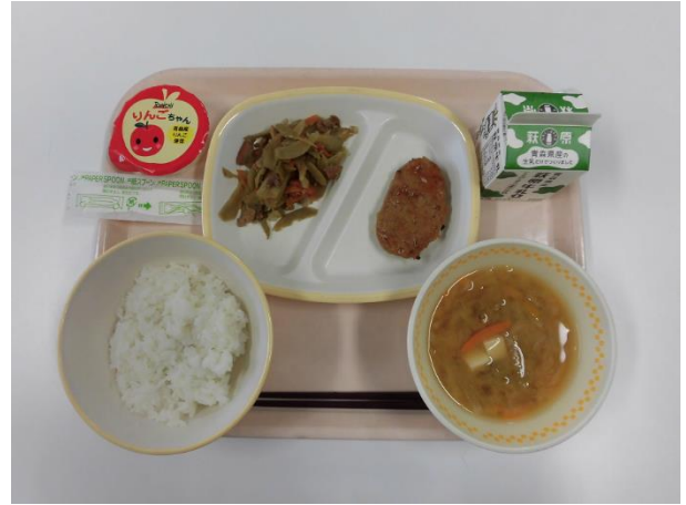
浅利栄養教諭による献立説明及び給食試食

【献立】ごはん、牛乳、ほたてのみそ汁、県産照り焼きハンバーグ、 県産きんぴらごぼう、果肉入りりんごゼリー