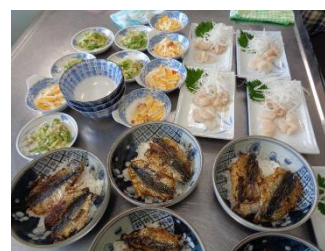
地産地消メニューの数々

魚を生から自分で調理すると、余すことなくつみれや骨せんべいなど食べることが出来、ごみが減り環境にも優しく、魚が住む場所を汚さない、という環境問題への取り組みを感じさせる非常に有意義な講座でした。