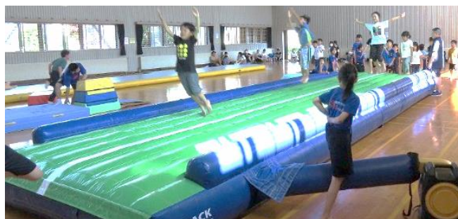
エアートランポリンで楽しく跳ねる児童

運動量が豊富で、ちょっと疲れたという児童もいましたが、それ以上に、あまり経験することがないエアートランポリンで跳ねたりしたことが楽しかったという感想があり、児童にとって貴重な体験になったようです。