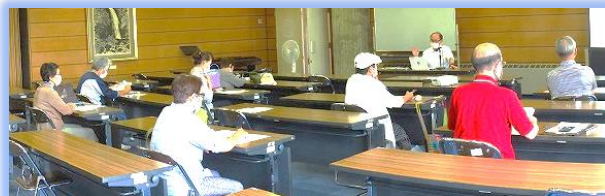
【3密を避けて講師の話に耳を傾ける参加者】

新型コロナウイルス感染症の怖さや変異株等についての新たな知識を得られたことがよかったという参加者の感想が聞かれました。