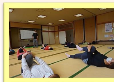
股関節や筋を伸ばす

手軽にできて効果のある運動は、「かかと上げ」でふくらはぎを鍛えること。「運動をする習慣」が大切と強調されていました。