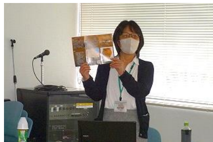
埋蔵文化財調査センターの紹介

平安時代の住居は、地面を掘ってつくる「竪穴建物」でしたが、中世になると地面に柱を建てて地上に建物をつくる「掘立柱建物」に変わります。石江遺跡群での多くの住居は2間×3間の大きさでした。有力者の住宅であつたらう大型の建物も見つかっています。お椀は、漆器が多く、当時工程を簡略化したものが大量に生産されたということです。陶磁器は全国各地・中国伝来のものが出土していて、新城・石江地区は日本海側と太平洋側からの流通の終着地として、要衝の地であつたと考えられます。また、すり鉢は多くの遺跡から出土しています。味噌汁、ごま和え、かまぼこなど、その後の食文化に大きな影響を与えた調理器具だと言えるそうです。衣類では、烏帽子、下駄、草履が見つかりました。宗教関連では、石江神明宮にある「山ノ神」と刻まれた石碑は、県内最古級の板碑である可能性が高いとのこと。文化財を通して昔の暮らしと新城・石江地区について知ることができた講座でした。