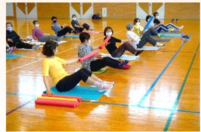
足を上げたままバトンリレー

最後は、足元に広げて置いた新聞を、3秒間で丸めて遠くに投げて終了しました。これは「ストレス発散」と全身運動です。