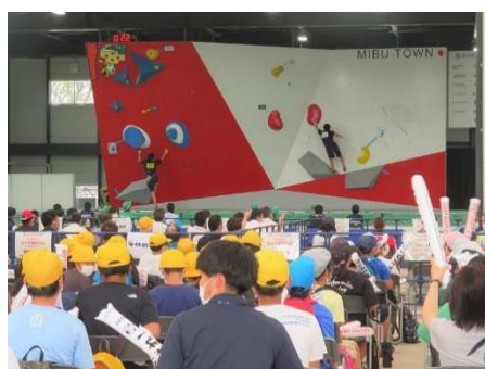
とちぎ国体の様子（スポーツクライミング学校応援）