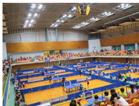
とちぎ国体の様子（卓球競技）