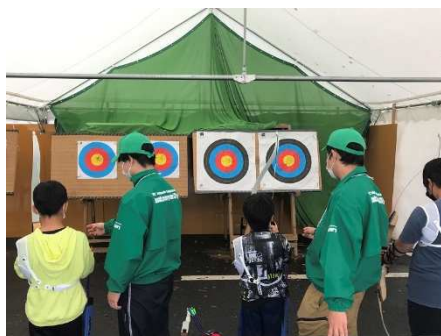
とちぎ国体の様子（アーチェリー体験）