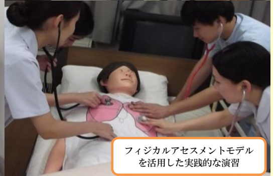
フィジカルアセスメントモデル を活用した実践的な演習