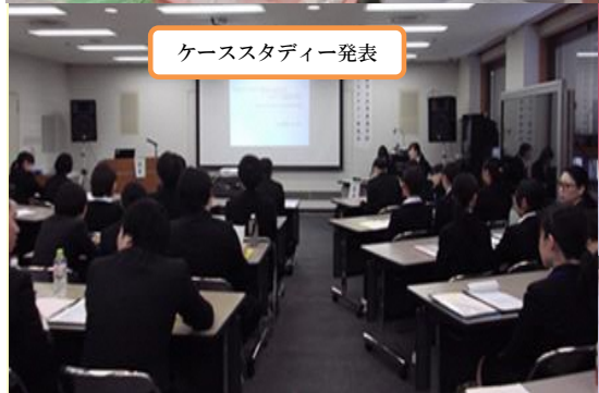
ケーススタディー発表