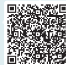
歴史資料室 調べ方案内