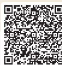
図書館HP おはなし会