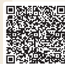
おはなしはまほう

子ども向けの広報誌「おはなしはまほう」や「赤ちゃんにおすすめの絵本」、「小学校の教科書に紹介されている本」のリストを作成・配布して、子どもに読んで欲しい本やおすすめの本を紹介しています。ぜひ一度手に取ってみてください。二次元コードからご覧いただけます。