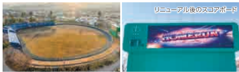
リニューアル後のスコアボード

選手の皆さんが安心・安全にプレーできるよう、グラウンドの段差解消やラバーフェンスの張替えなどを行ったほか、照明設備のLED化、映像や球速表示が可能なスコアボードへの更新など、観覧する方も楽しめる施設となりましたので、ぜひ、市宮野球場をご利用ください。