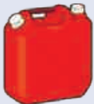
【灯油用ポリ容器】 ガソリンは入れられません!!