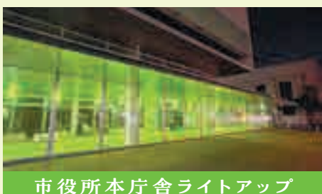
市役所本庁舎ライトアップ