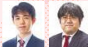
藤井聡太名人 糸谷哲郎八段