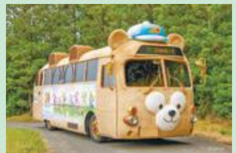
ダッフィーバスは2025年度のデザインです

内 ダッフィー&フレンズが描かれ、ダッフィーのぬいぐるみと同じ生地で車体をラッピングした特別仕様のバス「ダッフィーバス」を展示します。