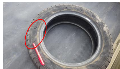
左前輪タイヤのパンク