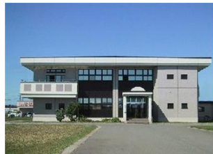
新田浄化センター