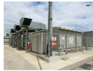
消化ガス発電施設