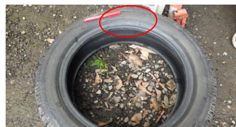
左後輪タイヤのパンク