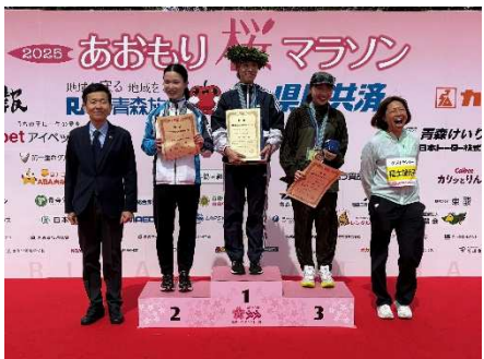
表彰式（フルマラソン女子）