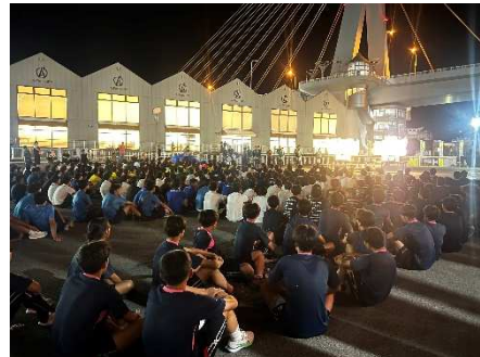
ねぶた囃子演奏披露・跳人体験（U-15・18）