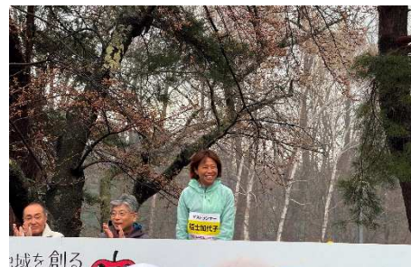
大会ゲスト（福士加代子氏）