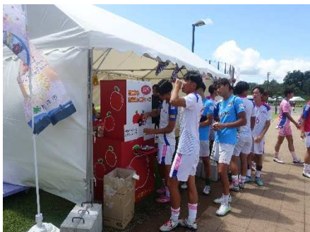
おもてなしブース