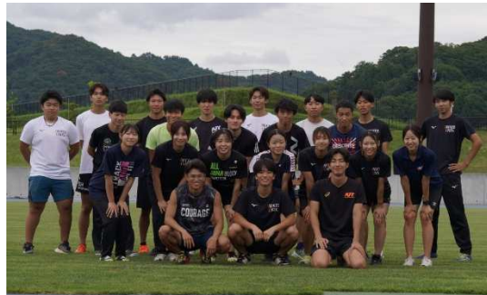
岩手大学陸上競技部