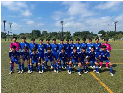
駒大苫小牧高校サッカー部