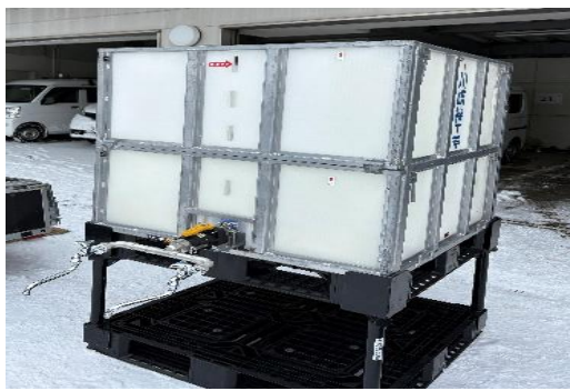
工具なしで組立可能