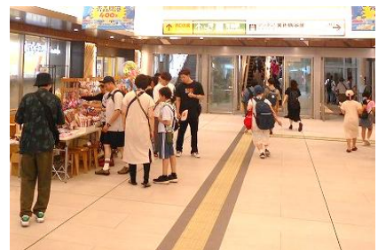
社会実験の状況（令和7年4月～令和8年3月）