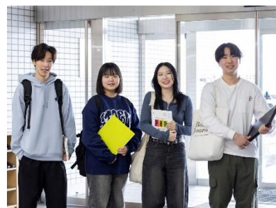
2025 年 3 月卒業生 就職実績