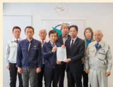
緊急要望書手交の様子