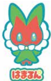
100周年記念セレモニーにおいて名前が発表された市営バス公式マスコット

A 交通部長 本年3月8日に100周年記念セレモニーを、令和8年度には、子ども会議委員の車内アナウンスによるバス停留所案内、公式マスコットグッズの販売、100周年記念誌デジタル版のホームページへの掲載、市営バス歴史パネル展の開催などを企画しています。