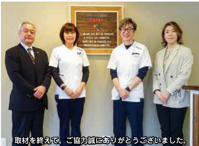
取材を終えて。ご協力誠にありがとうございました。

〔議員〕 まさに、かかりつけ薬剤師ですね。本日はお忙しい中、貴重なお話をありがとうございました。