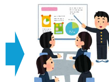
③活動報告会での発表