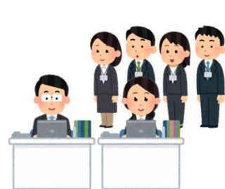
①打合せの同席や民間事業者との意見交換