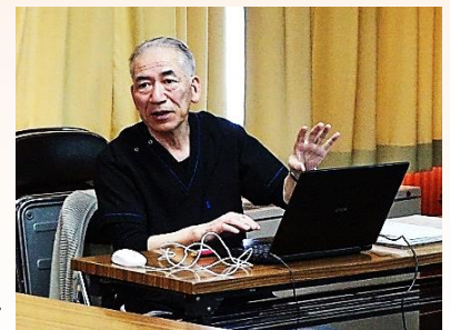
参加者に熱く語りかける神講師

⑩小腸ガンより大腸ガンが多い(〇)⇒人間の免疫力の60%~70%は小腸にあるから。⑭心臓にガンはない(〇)⇒ガンは36℃~37℃を好むが、心臓は常に熱を発生しガンにとっては棲みにくい環境である。そもそもガンは細胞の突然変異(細胞のコピーミス)だが、成人の心臓細胞は、ほとんど再生(コピー)しないから、などの「目から鱗」の知識とユーモアあふれる余談に、参加者は、満足感を得て帰路に着きました。