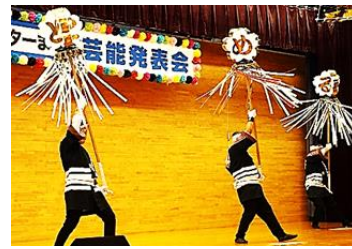
まとい：消防第二分団

9月27日(土)・28日(日) 古川市民センターまつりが盛大に開催されました。両日にわたる作品展示、体験コーナー、まつり食堂、初日の「古小まつり」そして、2日目の芸能発表会と、多くの地域の方々に支えられ、教育、文化、健康増進などの中核としての機能を十分に果たした2日間でした。