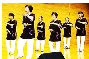
太極拳：太極拳ひまわり