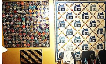
パッチワークサークル「山小屋」