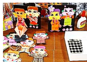
体験：ペーパークラフト