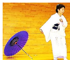
踊り：懐メロを偲ぶ会