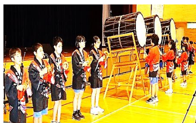
ねぶた囃子：古小児童有志