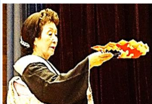
踊り：中央旭町千鳥会