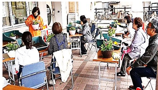
完成させたポットを前に最後のアドバイス

今回の寄せ植え作業は、越冬させて春にきれいな花を咲かせるパンジー、ピオラ、ナデシコの3種類の苗とチューリップの球根2個を大小2つの鉢に寄せ植えします。植え付けの条件は、鉢大には2種類の苗とチューリップの球根2個、鉢小には残り1種類の苗を単独で植え付けるというもの。受講者は、大小2つの鉢と、好きな色や形、花付きを見て苗と球根を選び、自由に苗を鉢に配置して土を盛りオリジナルの寄せ植えポットを完成させました。