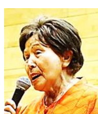
カラオケサークル「懐メロを偲ぶ会」「カラオケひまわり」