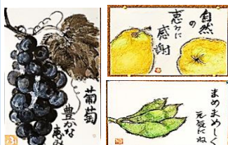
絵手紙サークル彩星会