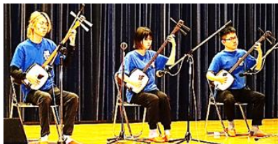
青森大学三味線部「あおしゃみ」