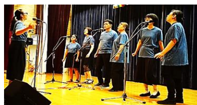
ゴスペル：Sounds Of Joy