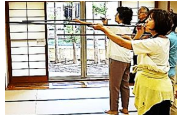
体験：スポーツウェルネス吹矢