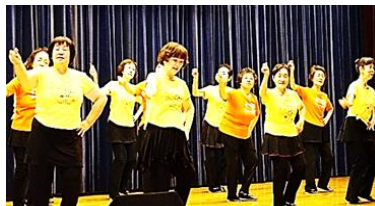
古川リズムクラブ