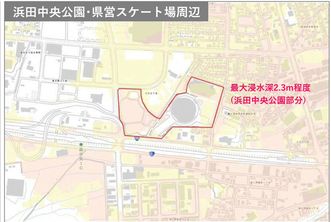
浜田中央公園・県営スケート場周辺