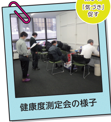
健康度測定会の様子